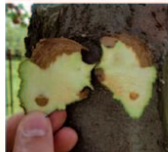
Flach verlaufende, oftmals leicht eingesunkene Rindennekrosen.

Schwächung der Pflanze durch die oben beschriebenen Symptome in Erscheinung zu treten. Die Verbräunungen erscheinen meist zuerst an verletzten Pflanzenteilen. In den Versuchen stellte sich heraus, dass in unseren Breiten die in den letzten Jahren zum Teil stark ausgeprägte Frühsommer- und Sommertrockenheit der Auslöser dieser Rindenerkrankung gewesen zu sein scheint, während der Einfluss der Temperatur als nachrangig anzusehen ist.