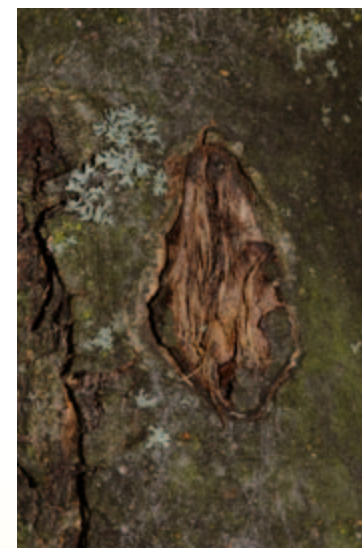
Wenige cm große tiefe Einsenkung in der Rinde

Man sollte den Bäumen, die weiter gepflegt werden, eine möglichst ausgeglichene Versorgung mit Wasser und Nährstoffen ermöglichen, um ihren Zustand zu stabilisieren. Bei lang anhaltender Trockenheit sollte bewässert und nach einer Bodenprobe die nötigen Nährstoffe nachgedüngt werden. Es empfiehlt sich, etwa 100 Liter pro Baum zu geben, um den Wurzelbereich möglichst durchdringend zu befeuchten. Außerdem