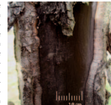
Stark betroffener Stamm mit schwarz gefärbtem, offen liegenden Splint.

sollte eine Baumscheibe um jeden Baum frei von jeglicher Vegetation gehalten werden, um eine mögliche Konkurrenz um Wasser und Nährstoffe auszuschließen und Wühlmäusen, die durch Wurzelfraß schaden, Versteckmöglichkeiten zu rauben. Verletzungen durch Mäharbeiten und große Schnittwunden sind dringend zu vermeiden, da sie neue Eintrittspforten für den Pilz bieten. Es werden trotzdem regelmäßige Schnittmaßnahmen, die die Vitalität der Bäume erhalten, empfohlen. Schnittwunden sollten entweder gar nicht mit einem Wundverschlussmittel bestrichen werden oder aber mit einem Fungizidhaltigen Mittel. Auf keinen Fall sollten Mittel ohne Fungizid verwendet werden, da dieses den Pilzbefall nur fördert. Diese Maßnahmen sind allerdings nur sinnvoll, wenn kein zu schwerer Befall vorliegt und noch Hoffnung auf eine Stabilisierung oder Besserung des Zustands besteht.