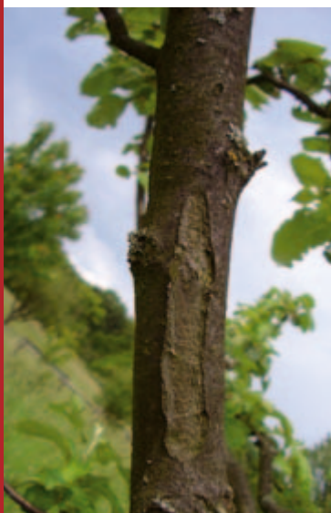
Großflächige Einsenkung in der Rinde