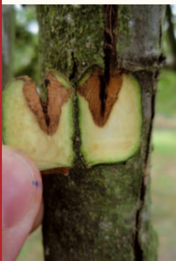
Nicht verheiltes Wundriss mit beginnender Nekrosenbildung.

Seit dem heißen und trockenen Jahr 2003 erregten Meldungen über absterbende Apfelbäume und eine „neuartige Rindenerkrankung“ nicht nur beim zuständigen hessischen Pflanzenschutzdienst große Besorgnis, sondern sorgten auch in der regionalen und überregionalen Presse sowie in der Öffentlichkeit für verstärkte Aufmerksamkeit.